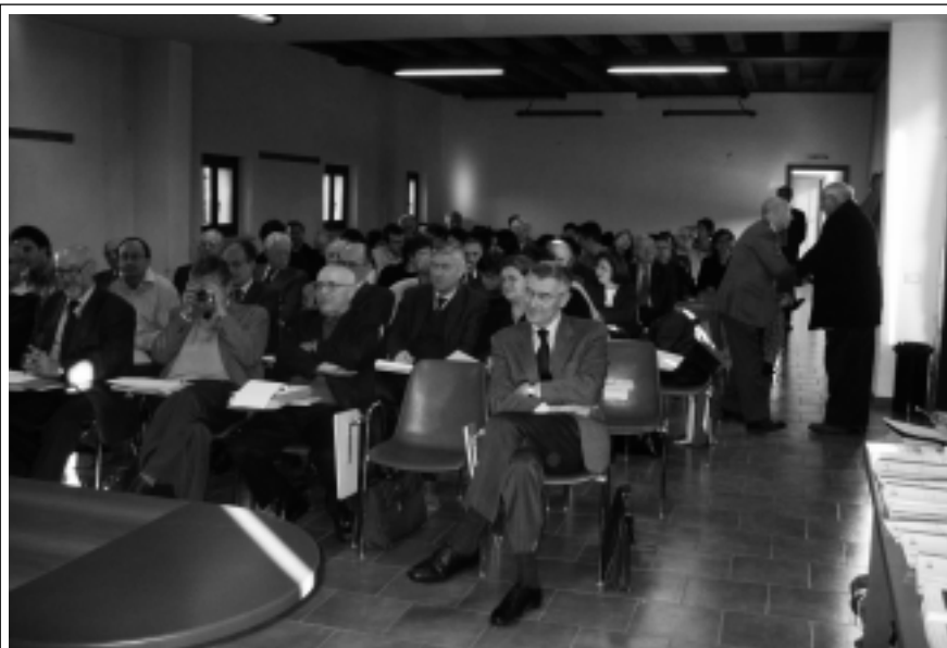
VERONA - Il pubblico che riempiva la sala di Corte Molon nella mattinata di sabato

Verona, 13-14 dicembre: week-end nazionale di dibattito LE NUOVE FRONTIERE DEL FEDERALISMO