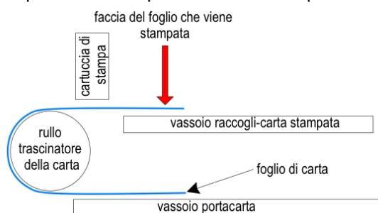
Fig. 1 — Percorso della carta nelle stampanti che stampano sulla facciata posteriore del foglio.