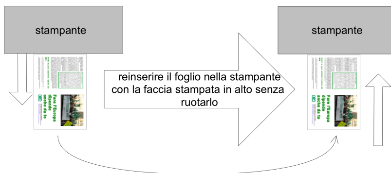
Fig. 2 — Reinserire i fogli nel vassoio porta-carta della stampante mantenendo in alto la faccia stampata.